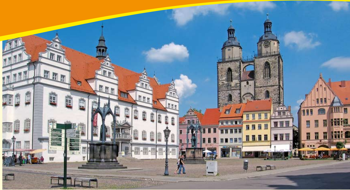
Marktplatz von Wittenberg