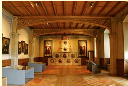
Hörsaal im Lutherhaus